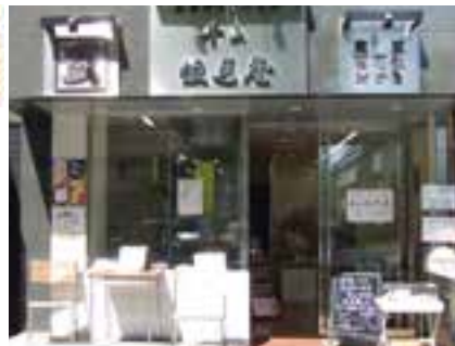
青山但馬屋 〒107-0061 東京都港区北青山2-7-11 Tel.03-3401-2843 平日 10:00am~7:30pm 土・日・祝 10:00am~6:00pm

神宮野球場や秩父宮ラグビー場も目と鼻の先にあり、秋には銀杏並木の紅葉も大変きれいですので、野球やラグビーの観戦の時や散策のついでにぜひ当店にもお立ち寄りください。私が笑顔!!でお迎えいたします。